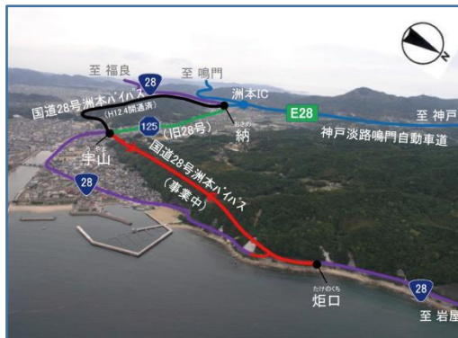
【工事中の洲本バイパス潮トンネル】