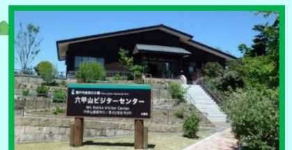
県立六甲山ビジターセンター