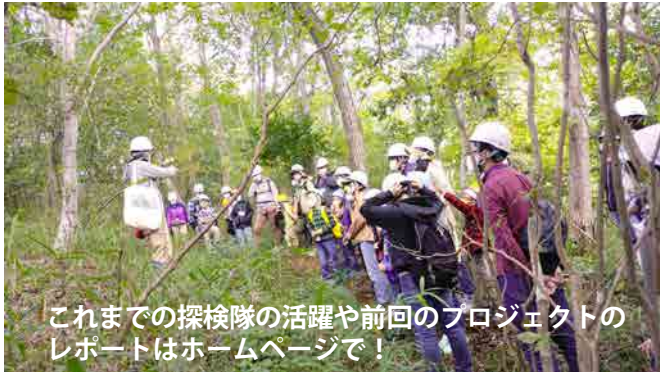
これまでの探検隊の活躍や前回のプロジェクトのレポートはホームページで！

有馬富士公園のかやぶき民家近くにある「棚田・里山景観保全エリア」その裏手にある里山の再生が始まった。その名も「里山再生プロジェクト」あれから2年。探検隊第2陣の募集だ。