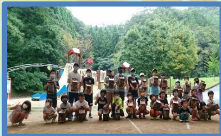
市川町緑の少年団アウトドア体験会