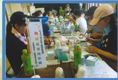
大久保駅前夏祭り