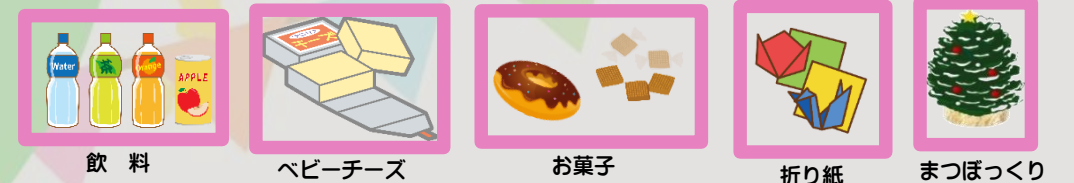
飲料 ベビーチーズ お菓子 折り紙 まつぼっくり

応援団に登録されている青少年団体・グループが青少年の健全育成を目的として実施する活動に対して、企業などから提供していただいた資源を橋渡しします