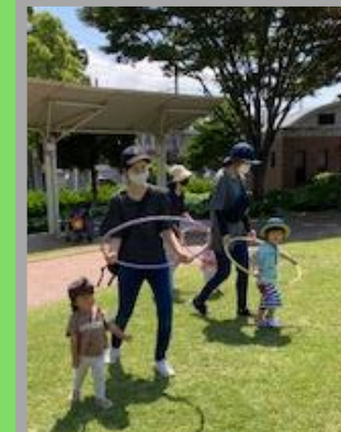
青空の下 広場で遊ぼう!