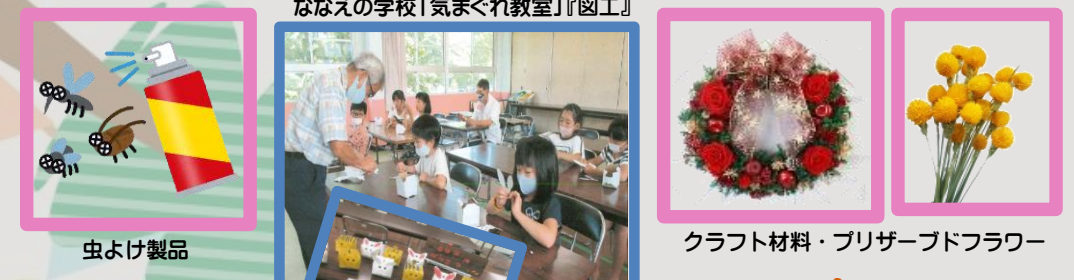
虫よけ製品 ななえの学校「気まくれ教室」「図工」 クラフト材料・プリザーブドフラワー