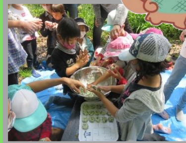
猪名の里のすてきな宝物を楽しもう