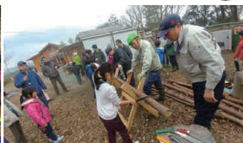
里山の環境整備のために間伐された木を使ってノコギリ体験もやってみよう。