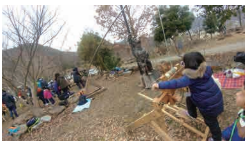
「グリーンウッドワーク」とは生木を伝統的な手工具を使って加工するモノづくりのことなんだって。