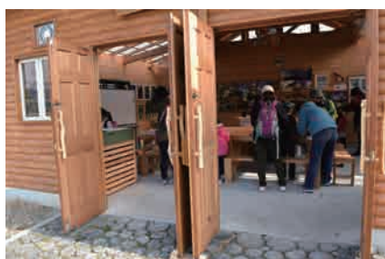
集合場所の「きずき小舎」は休憩場所にもなってる。近くには新設トイレもあって安心。