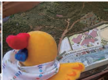
双眼鏡は貸してくれる