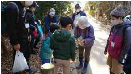
ふるさと小径で秋の昆陽池公園を観察

FAXで送られる方は送信後に到着確認のお電話をいただきますようお願いいたします。