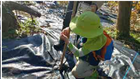
野鳥の島へ渡りクヌギを植樹