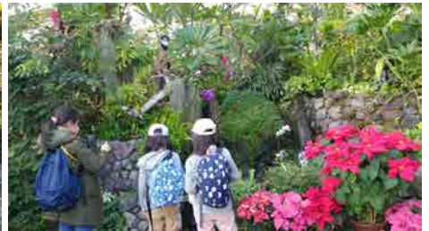
伊丹市昆虫館のチョウ温室