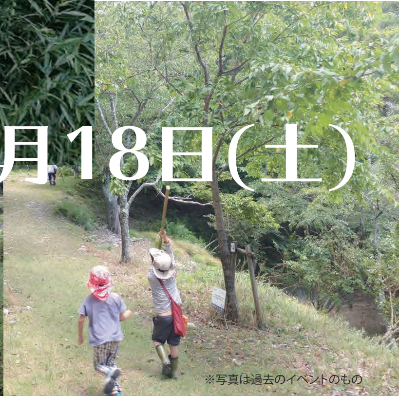
※写真は過去のイベントのもの