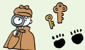
犬のホームズと仲間たち ▶