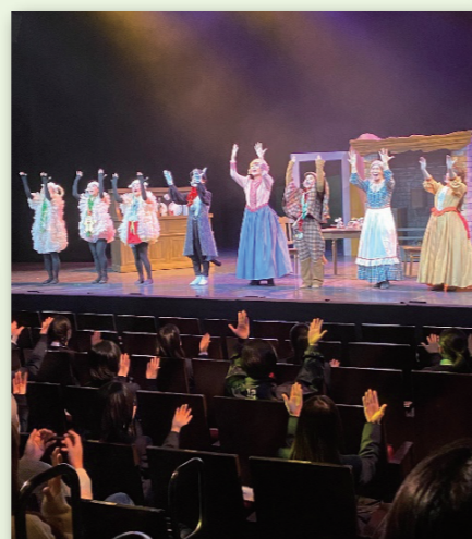
▲出演者と一緒に座ったままダンス