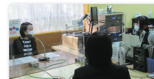
FMあまがさきにて「スマホ婚活」の紹介をしました。

〒660-0881 尼崎市昭通2-6-68 尼崎市中心企業センター 6階 TEL:06-6481-7370 FAX:06-6481-7401 受付時間 火・金・土・日 9:00~17:15 駐車場 有り(有料) https://www.msc-hyogo.jp/