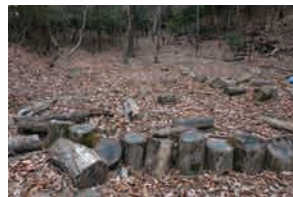
里山整備で出た木々で活用! のこぎり体験やトンカチ体験