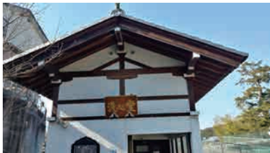
秘密基地ながらトイレは近い! (近代的なお寺トイレ?)

参考:観瀧山 岡本寺ホームページ https://www.kohonji.jp/