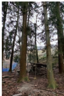
高さ〇メートルのプランコ どうやって木の上にかけた?