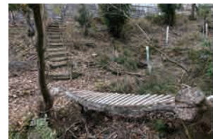
極寒の中「序」で終わるのか 完成するのか?