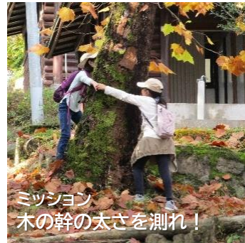
ミッション 木の幹の太さを測れ！