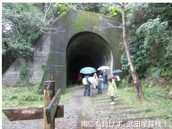
雨にも負けず、武田尾探検！

※本事業はマスクの着用・手指消毒など 新型コロナウイルス感染予防対策の上、 実施しています。