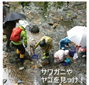
サワガニや ヤゴを見つけ！