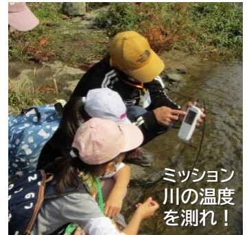
ミッション 川の温度を測れ！