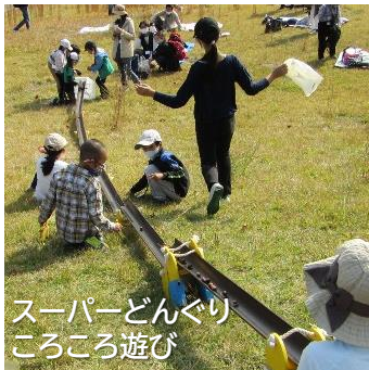
スーパーどんぐり ころころ遊び