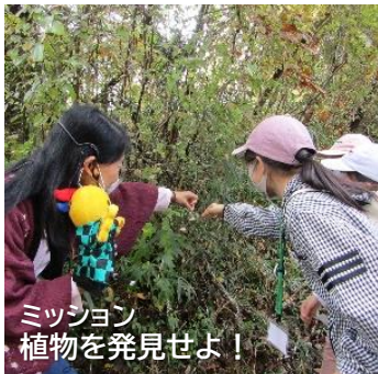
ミッション 植物を発見せよ！