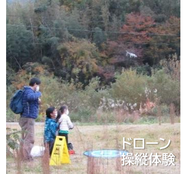
ドローン 操縦体験