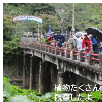
植物たくさん 観察したよ