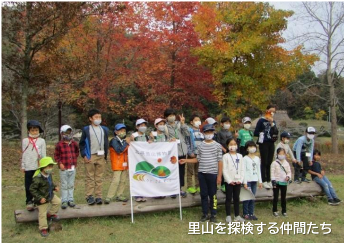
里山を探検する仲間たち