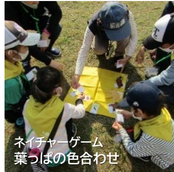
ネイチャーゲーム 葉っぱの色合わせ