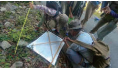
家族単位で指導員が説明してくれる！

FAXで送られる方は送信後に到着確認のお電話をいただきますようお願いいたします。