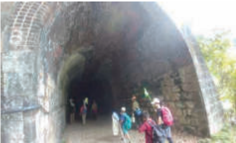
廃線敷とトンネルは探検心をくすぐります