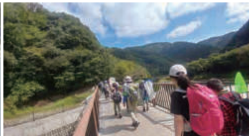
宝塚駅から8分でこの自然に出会える！