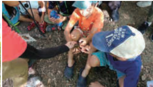
捕まえた生きものを集めて観察しよう！