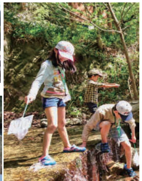
大人気の小川の生きもの探し！