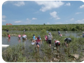
【加古川での水生生物観察】

【実施日】 令和元年7月27日(土) 小学生25名、保護者27名 令和元年8月17日(土) 小学生20名、保護者20名 令和元年8月24日(土) 小学生23名、保護者22名 JR加古川線(貸切電車) 加古川河川敷(小野町駅)、鬪龍灘(滝駅)