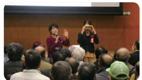
【青少年健全育成セミナー】