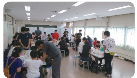
【明石工業高等専門学校】