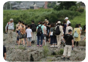
【登龍灘での植物観察】