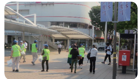
【大人が変われば子どもも変わる キャンペーン啓発活動】