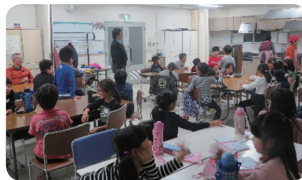
【子ども食堂体験活動】