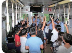
【走る環境学習教室】