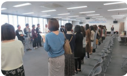
【東播磨地域 縁結び交流会】

〒673-0891 明石市大明石町1-2-1 明石商工会議所ビル1階 TEL (078)920-9337 FAX (078)920-9338 *受付日時 木・金・土・日(祝祭日を除く) 9:00~17:15