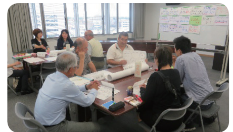
【講演、オリエンテーション】