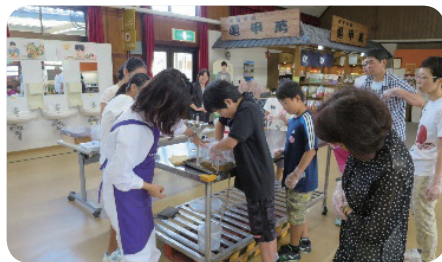
【キッコーマン食品(株)高砂工場】