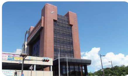
【東播磨出会いサポートセンター】