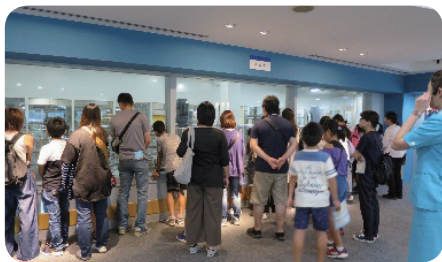
【サントリープロダクツ(株)高砂工場】

【実施日】 令和元年7月24日(水) 11組22名 アサヒ飲料(株)明石工場、県立農林水産技術総合センター 令和元年7月30日(火) 16組32名 山陽電気鉄道(株)東二見工場、明石市防災センター 令和元年8月9日(金) 18組36名 明石市防災センター、六甲バター(株)稲美工場 令和元年8月21日(水) 20組40名 キッコーマン食品(株)高砂工場、国立明石工業高等専門学校 令和元年8月22日(木) 19組38名 アサヒ飲料(株)明石工場、昭和住宅(株)稲美工場 令和元年8月27日(火) 16組32名 サントリープロダクツ(株)高砂工場・ポリテクセンター加古川 令和元年8月29日(木) 9組18名 (株)有馬芳香堂、キャタピラー・ジャパン(同)明石事業所 令和元年8月30日(金) 14組28名 山陽電気鉄道(株)東二見工場・シスメックス(株)アイスクエア