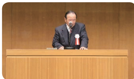
【東播磨青少年本部長挨拶】