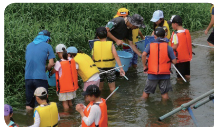
【サマーフェスティバル in 加古川大堰】