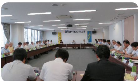
【第1回スクラム会議】