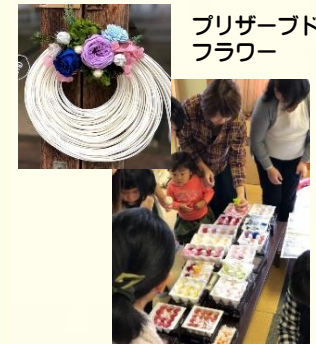
プリザーブド フラワー

応援団に登録されている青少年団体・グループが青少年の健全育成を目的として実施する活動に対して、企業などから提供していただいた資源を橋渡しします