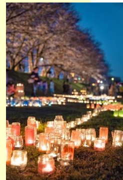
夢咲さくらキャンドルナイト