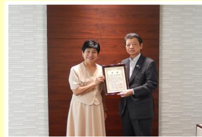
一般財団法人尼信地域振興財団 様