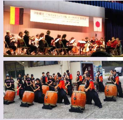
ベルリンカニジウス高校オーケストラ 来県演奏・交流会

創立50周年を記念して、次世代育成の基礎となるような国際交流・人材育成などのプログラムの事業化を応援 1件あたり50万円を限度として助成 ○今年度の募集は終了