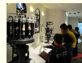
工場見学 (飲料メーカー工場)