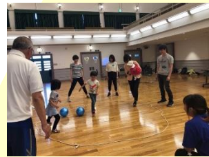
子どものロコモ予防