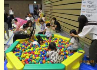
とよおか・こどもまつり