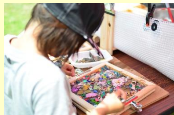
新温泉町子ども自然体験