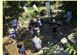
アウトドア体験会