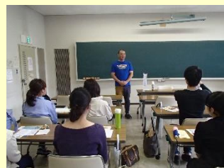
ボランティア活動はじめての一步 ～青年リーダー養成～