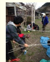
人材派遣 (ロープワーク指導)