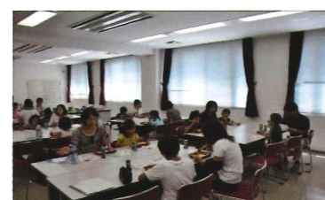
事業後の懇親会でのお弁当♪

参加者の皆さんに喜んでいただけることで十分です。その事業にあった特別メニューなども考えられたらと思います。出来る限りのことをさせていただきたいと思っています。