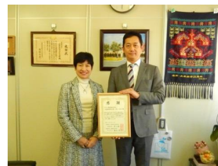
アサヒ飲料(株) 近畿圏統括本部 近畿圏第二支社 様

兵庫県青少年本部では、創立50周年を迎え、長年にわたりご支援をいただいた協力企業様に、感謝状の贈呈を行いました。