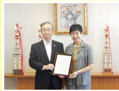
一般財団法人尼信地域振興財団 様