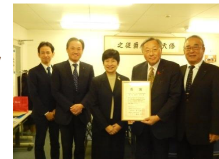
兵庫県モロロジー 青少年団体連絡協議会 様