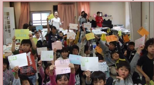
【理科実験工作教室】

問合先：〒651-0093 神戸市中央区二宮町1丁目12-10 TEL/FAX078(231)6201 E-mail:office@kobe.ywca.or.jp