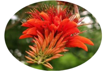
沖縄の県花 デイゴ