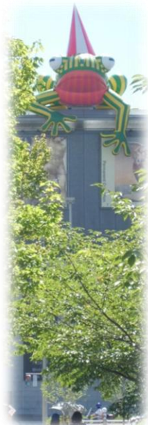
兵庫県立美術館のシンボル “美(み)かえる”と同美術館

公益財団法人 兵庫県青少年本部 活動支援担当 TEL 078-891-7410 FAX 078-891-7418