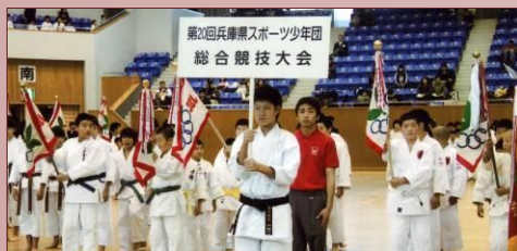
【総合競技大会総合開会式】

問合先：〒650-0011 神戸市中央区下山手通4丁目16-3 兵庫県民会館6階 公益財団兵庫県体育協会内 TEL078(332)2344 FAX078(332)2375 E-mail:suposyou@hyogo-sports.jp