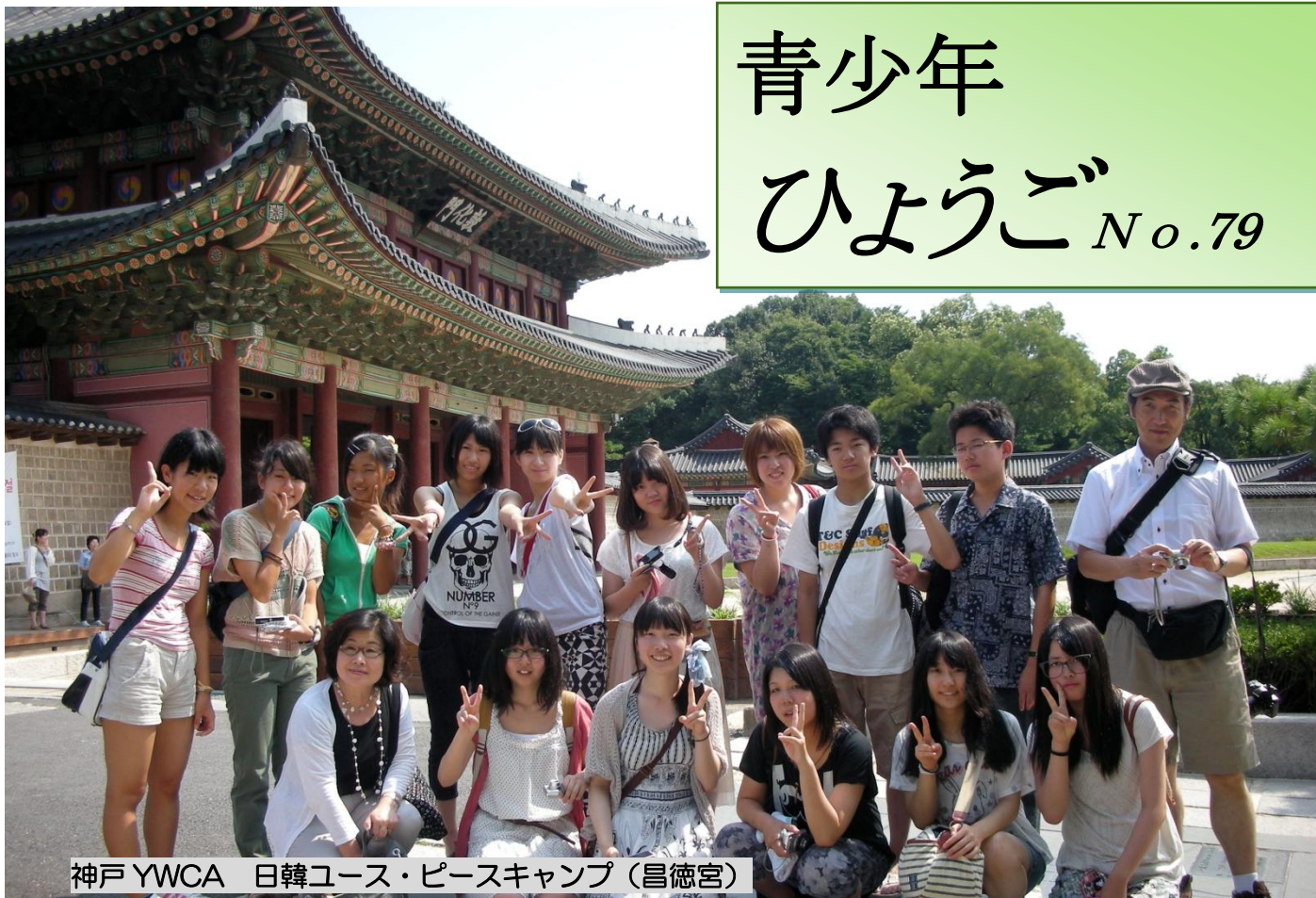
神戸YWCA 日韓ユース・ピースキャンプ(昌徳宮)