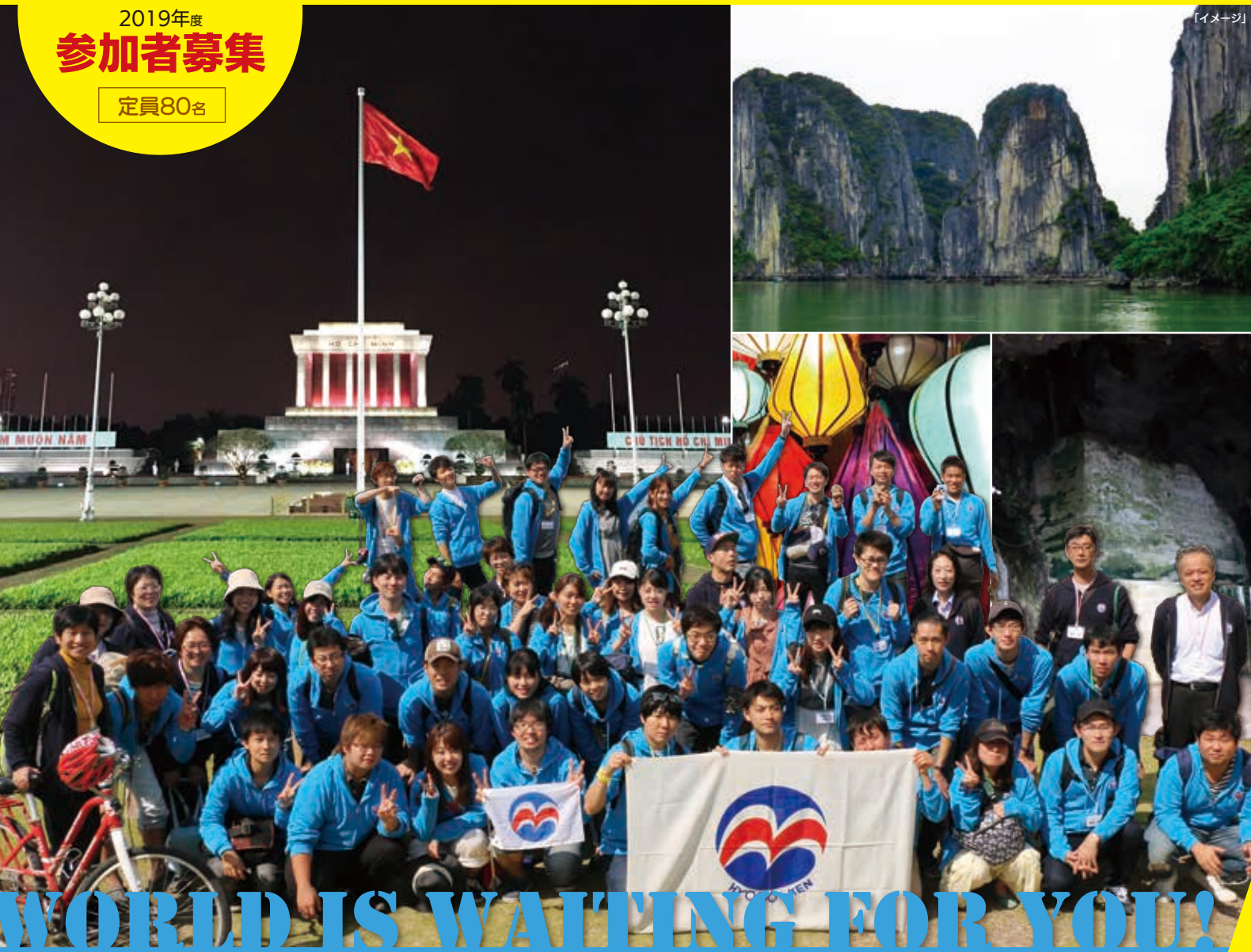
掲載されている写真はイメージです