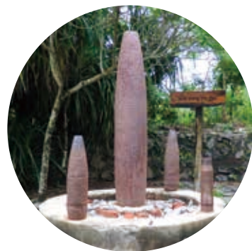
キャノンフォート（戦争遺跡）