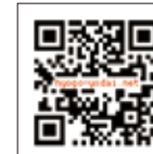
兵庫県青年洋上大学HP

現在も毎週火曜日に開催されている定例会をはじめ、年間を通じて会員相互の交流や様々な社会活動が行われます。